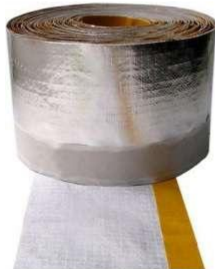
Робибанд ВМ А 100 * 18,

Лента «Робибанд ВМ А» является составной частью системы герметизирующих материалов торговой марки «Робибанд», применяемых для организации вентилируемого монтажного шва. Система «Робибанд» полностью соответствует современным техническим нормам: ГОСТ 30971-2012, СТО НОСТРОЙ 2.23.62-2012 и т.п. Надежность и долговечность монтажного шва обеспечивается только комплексным применением системы «Робибанд». Применение каждого материала в отдельности или их неполного сочетания лишь частично улучшает характеристики шва и не обеспечивает комплексной защиты от широкого спектра негативных эксплуатационных воздействий, оказываемых на шов в течении всего срока его службы.